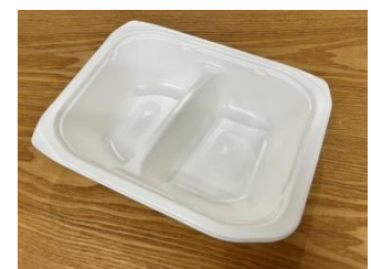
新モールドトレイ